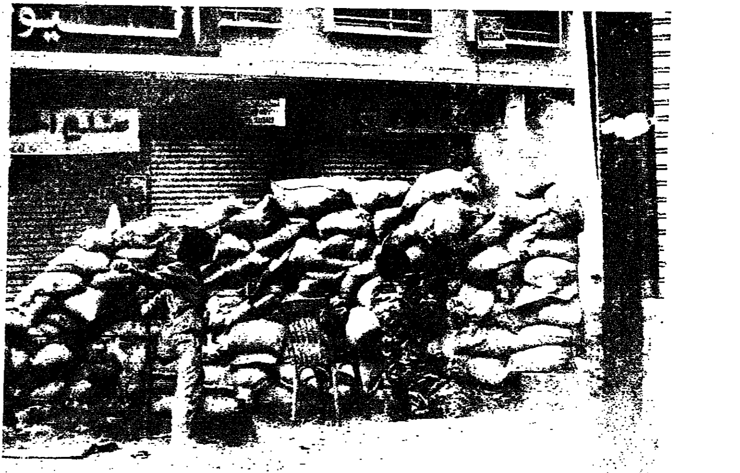
■ ... وعادت المفاريس الضخمة الى الشوارع